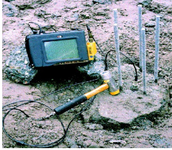
Şekil-2. Deney ekipmanının kazık üzerinde hazır hali

için kullanılmamalıdır. Bütünlük Deneyi ile iyi sonuç için: kazık başı temiz olmalı, el altında ulaşılabilir yerde olmalı, ses ve hareketli sudan etkilenmeyecek uzaklıkta olmalıdır. Yerde dökme kazıklar, en azından 5 günlük olmalı ve demiri betonu bilinen malzemelerden yapılmalıdır. Bütünlük deneyi genellikle prekast eklemeli veya kalıcı muhafaza borulu kazıklar için uygun değildir.